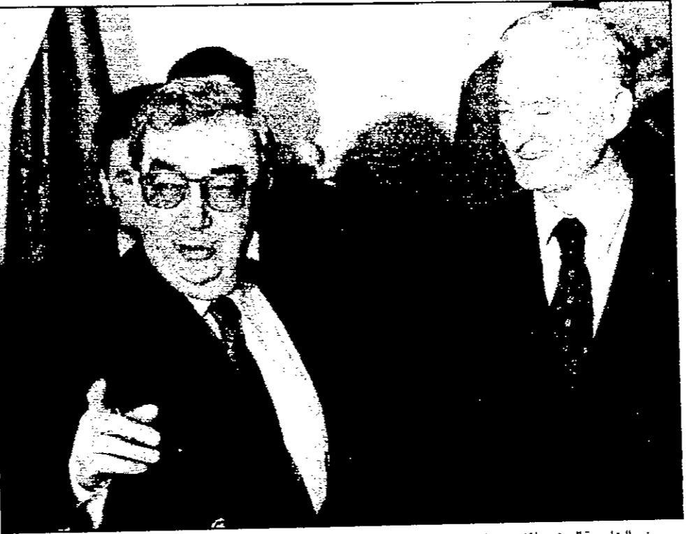
وزير الخارجية اليوغوسلافي جوفانوفيتش ووزير الخارجية الروسي بريماكوف قبل بدء مباحثاتهم أمس في بلغراد

باريس - بريشينا، وكالات: يتوجه وزير الخارجية الفرنسي جوييفيرين والاماني كلاهما في زيارة لبلغراد في وقت لاحق من اليوم، ليقابلوا ميلوسيفيتش في محاولة لفتح حوار حول كوسوفو. ويعد هذا الحوار من الامم المتحدة، وهو يهدف الى ايجاد حل سلمي للوضع في كوسوفو. ويعد هذا الحوار من الامم المتحدة، وهو يهدف الى ايجاد حل سلمي للوضع في كوسوفو.